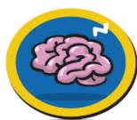
Onthoud- & Doe kracht

Sinds dit schooljaar werken we in alle klassen aan het versterken van de executieve functies van kinderen. Executieve functies zijn functies in je brein die het mogelijk maken om je gedrag en je leren te sturen. Het gaat bijvoorbeeld over het vermogen om te organiseren, je te kunnen concentreren of om je gevoelens en gedrag te reguleren.