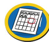
Plan- & Regel kracht